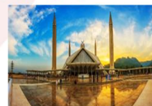
มัสยิดไฟซาล

DAY8 ตึกศิลา-พิพิธภัณฑ์ตึกศิลา-อิสลามาบัด- มัสยิดไฟซาล-Shopping-กรุงเทพ