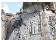
พระพุทธรูปคาร์กาห์

** พักที่ Kallisto Hotel หรือเทียบเท่า **