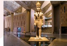
Grand Egyptian Museum