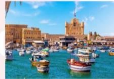
เมืองอเล็กซานเดรีย