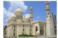
Abu Al-Abbas Al-Mursi