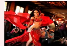
ชมระบำหน้าห้อง

** พักที่ Saray Pyramids & Museum View Hotel Hotel 4* หรือเทียบเท่า **