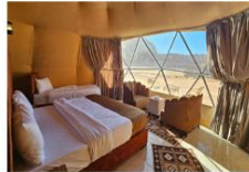
นอนแคมป์ Bubble Dome

** พักที่ Luxury Wadi Rum Magic Bubble Dome 4* หรือเทียบเท่า **