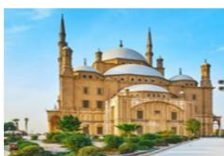
ป้อมปราการแห่งไคโร

15.25 น. เดินทางถึงสนามบินสุวรรณภูมิ กรุงเทพ โดยสวัสดิภาพพร้อมความประทับใจ