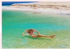
ทะเลเดดซี

** พักที่ Grand East Dead Sea Hotel 4* หรือเทียบเท่า **