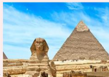
มหาพีระมิดกิซา, สฟิงซ์