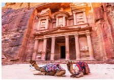
เมืองเพตรา