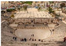
โรงละครโรมัน