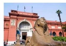
The Egyptian Museum

** พักที่ Saray Pyramids & Museum View Hotel 4* หรือเทียบเท่า **