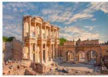
เมืองเอเฟซุส