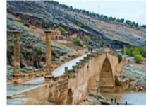
สะพานเซเวอร์รัน