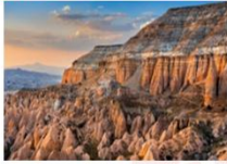
เมืองคัปปาโดเกีย

** พักที่ Dedeli Cave Hotel 5* หรือเทียบเท่า **