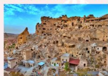
นครใต้ดิน