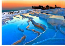
เมืองปามุคคาเล่

** พักที่ Richmond Thermal Hotel 5* หรือเทียบเท่า **