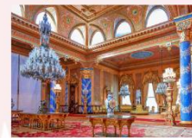
Beylerbeyi Palace ล่องเรือช่องแคบบอสฟอรัส