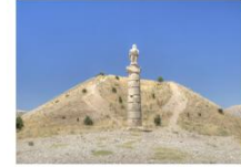
สุสานคาราคูช