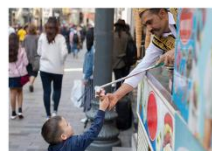
ไอศกรีม Maraş ชมพระอาทิตย์ตกดิน ณ ภูเขาเนมรุต