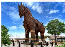
เมืองชานัคคาเล่

** พักที่ Cura Hotel 4* หรือเทียบเท่า **