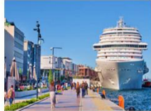
ล่องเรือช่องแคบบอสฟอรัส