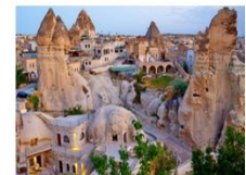
คาราวานสโรน