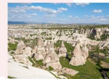
หุบเขาเดเฟเรนท์

** พักที่ Dedeli Cave Hotel 5* หรือเทียบเท่า **