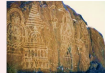
เมืองชิลาส

** พักที่ Shangrila Chilas Hotel หรือเทียบเท่า **