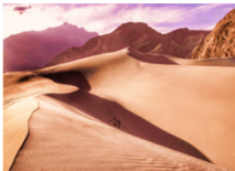
ทะเลทรายคัทปานา