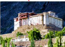
บ่อมบัลดิท