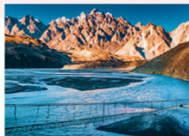
สะพานแขวนฮุสไซนี

** พักที่ Sarai Silk Route Hotel หรือเทียบเท่า **