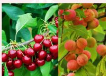
สวนผลไม้ตามฤดูกาล

** พักที่ Duiker Hard Rock Hotel หรือเทียบเท่า **