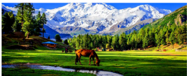
แฟร์มีโดวส์

** พักที่ Raikot Sarai Hotel หรือเทียบเท่า **