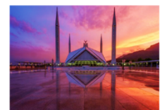
มัสยิดไฟซาล

19.30 น. นำท่านเดินทางสู่สนามบินอิสลามาบัด 23.20 น. ออกเดินทางสู่กรุงเทพ เที่ยวบิน TG350