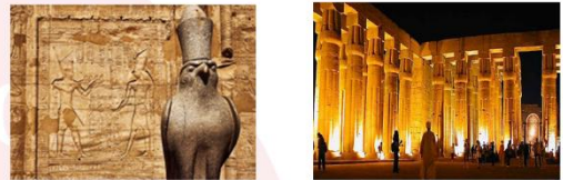
วิหารเอ็ดฟู