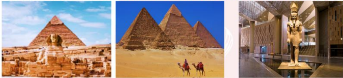
มหาพีระมิดกิซา Grand Egyptian Museum

** พักที่ Mamlouk Pyramids Hotel 4* หรือเทียบเท่า **