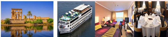
วิหารฟิเล เรือสำราญ Jaz Crown Prince Cruise 5*

07.00 น. ออกเดินทางสู่เมืองอัสวาน สายการบิน...เที่ยวบิน... 08.15 น. เดินทางถึงสนามบินอัสวาน