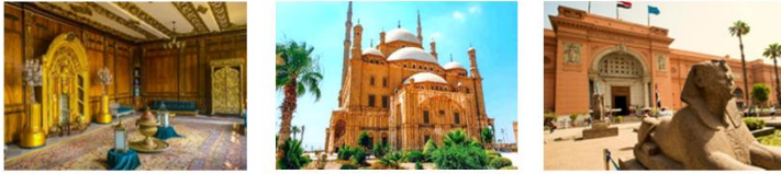
Manial Palace Salah EL Din Citadel & Mohamed Ali Mosque The Egyptian Museum

06.10 น. เดินทางถึงสนามบินอิสตันบูล แวะเปลี่ยนเครื่อง 07.55 น. ออกเดินทางสู่กรุงโคโร ประเทศอียิปต์ เที่ยวบิน TK690 09.20 น. เดินทางถึงสนามบินกรุงโคโร