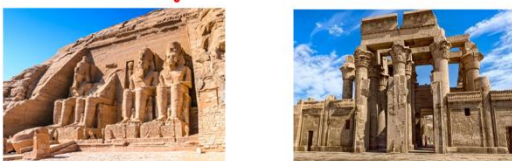
มหาวิหารอาบูซิมเบล วิหารคอมอมโบ

** พักที่ Jaz Crown Prince Cruise 5* หรือเทียบเท่า **