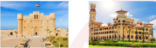
ป้อมปราการซีตาเดล พระราชวังอัลมอนด์อาซาร์

** พักที่ Mamlouk Pyramids Hotel 4* หรือเทียบเท่า **