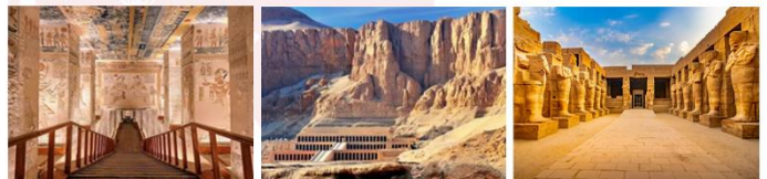
หุบผากษัตริย์ วิหารอักเซฟซุต มหาวิหารคาร์นัค

19.45 น. ออกเดินทางสู่กรุงโคโร สายการบิน...เที่ยวบิน... 21.00 น. เดินทางถึงสนามบินกรุงโคโร